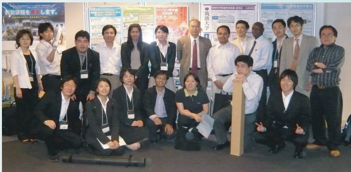
空間情報科学研究室のメンバー